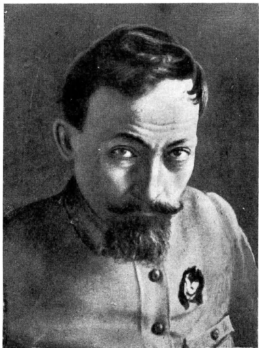
Ф. Э. ДЗЕРЖИНСКИЙ