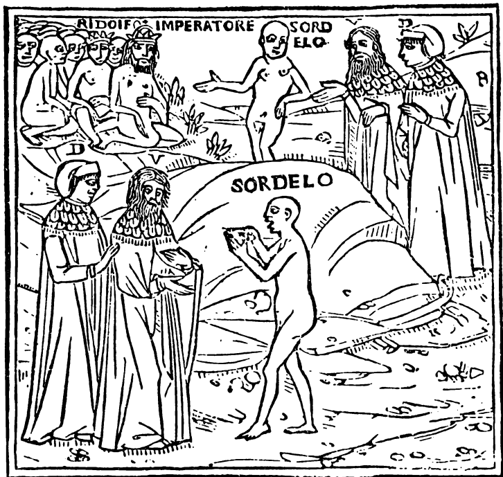
Сордель. Гравюра XV в., включенная в первое издание «Божественной комедии» (1491)

ее другой трубадур, Монах Монтаудонский, сочинил песню с юмористическими портретами 16 других поэтов (в виде единственного здесь исключения мы ограничились, не рискуя утомлять читателя однообразием, переводом всего двух строф из нее).