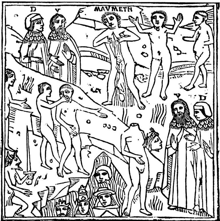
Трубадур Бертран де Борн в Дантовом «Аду», несущий отсеченную от тела собственную голову. Гравюра XV в., включенная в первое издание «Божественной комедии» (1491)

В толпе, кружащей неисчетный раз, И срезанную голову держало За космы, как фонарь, и голова Взирала к нам и скорбно восклицала: