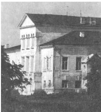
Дом И. И. Лажечникова в с. Коноплино