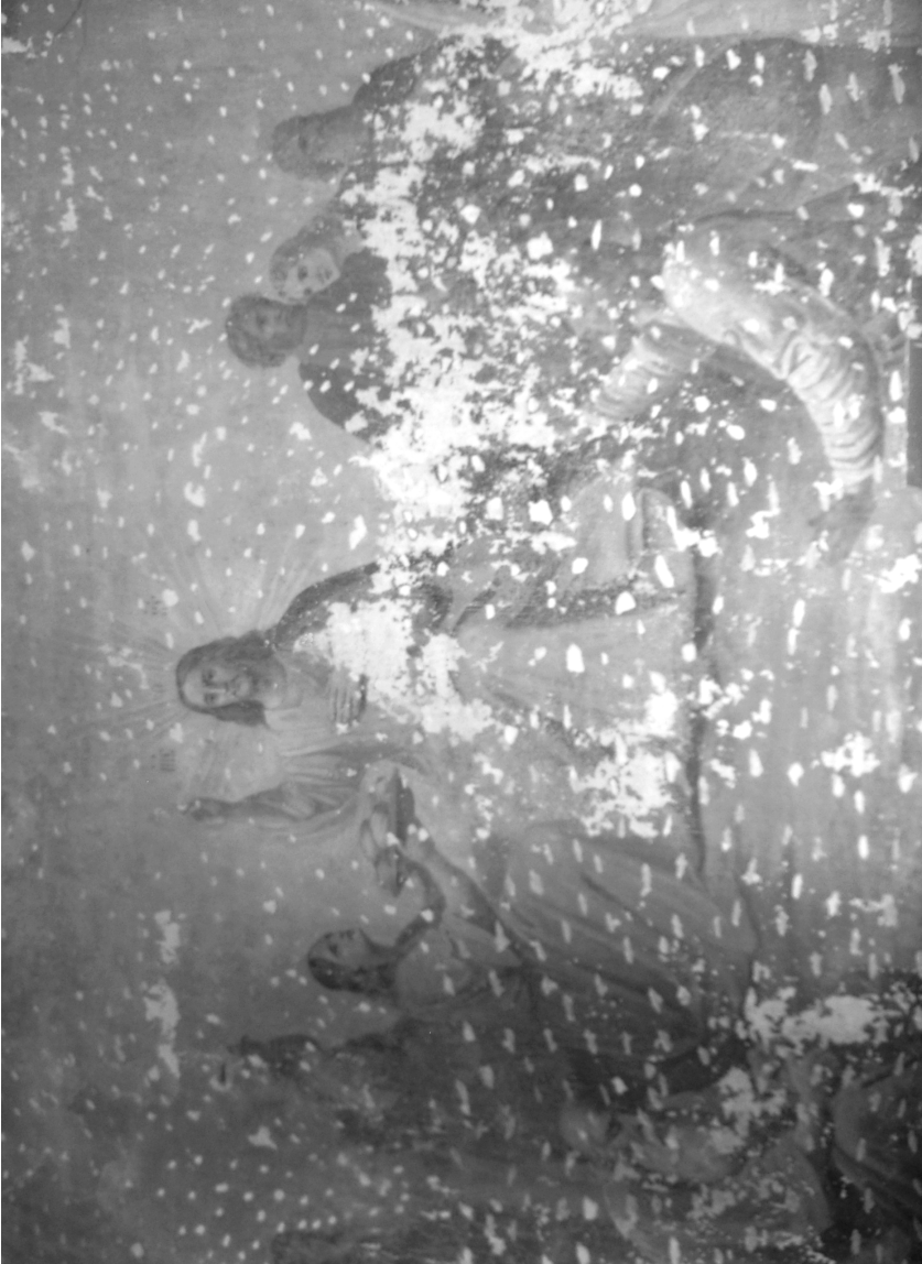
Настенные фрески в усадьбе Коноплино