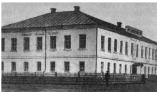
Здание уездного Старицкого училища, на открытие которого 6 ноября 1834 года побывал директор департамента нар. училищ Тверской губернии И. И. Лажечников