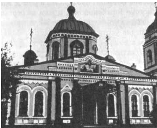
Троицкий собор Мариинского монастыря в с. Коноплино