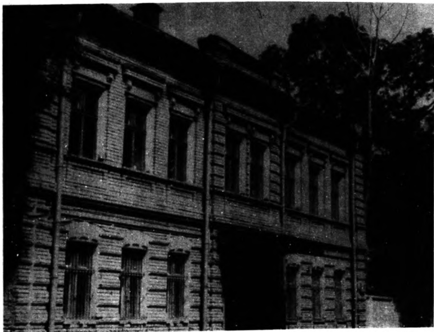
Дом в Толмачевском переулке